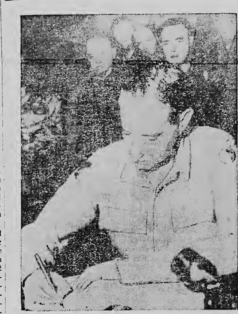
DRIE UUR, nadat in Pan Mun Djon de bestandsovereenkomst door de afgevaardigden werd ondertekend, bekrachtigde generaal Mark Clark, de opperbevelhebber van de Ver. Naties, haar op zijn hoofdkwartier, dat gevestigd werd in Seoul. Clark was niet bijzonder optimistisch en zeide in een dagorder tot de troepen: Vergeet niet dat dit slechts een mogelijk tijdelijk afbreken van de vijandelijkheden betekent.